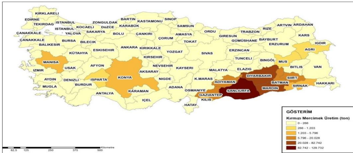
Harita 1. Ülkemizin İllere Göre Kırmızı Mercimek Ekiliş Yoğunlukları

Ülkemizde kırmızı mercimek yurt içi kullanımı yıllık 430 bin ton civarındadır (TÜİK verilerine göre 2019 yılı kişi başı yıllık tüketim miktarı 4,6 kg'dır).